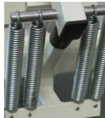
Les ressorts facilitent l'ouverture et la fermeture de la plaque supérieure.

mation de votre machine, veuillez demander une offre.