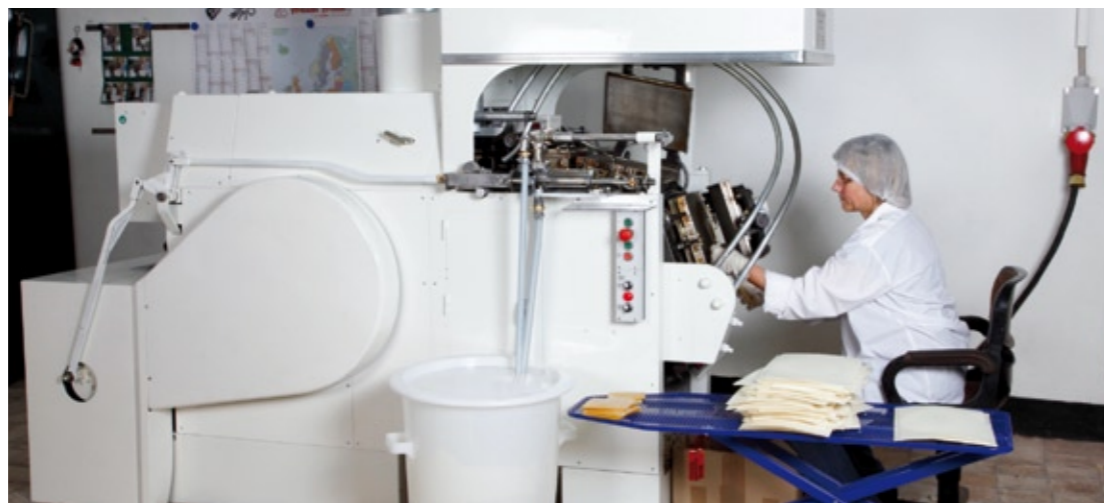
Les collaboratrices du service distribution essaient elles-mêmes de produire des hosties sur cette machine automatique révisée

Une grande machine automatique à faire des hosties, qui a fait son œuvre pendant de longues années dans un cloître maintenant désaffecté, a été révisée complètement pendant plusieurs semaines avant de recevoir une nouvelle peinture. La «marche d'essai» a été finalement réalisée au printemps 2011 par les collaboratrices de l'administration.