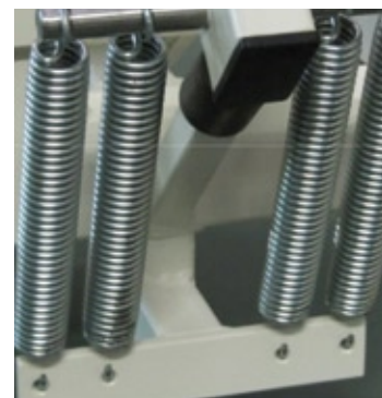
Un resorte regulador facilita la apertura y cierre de la plancha superior.