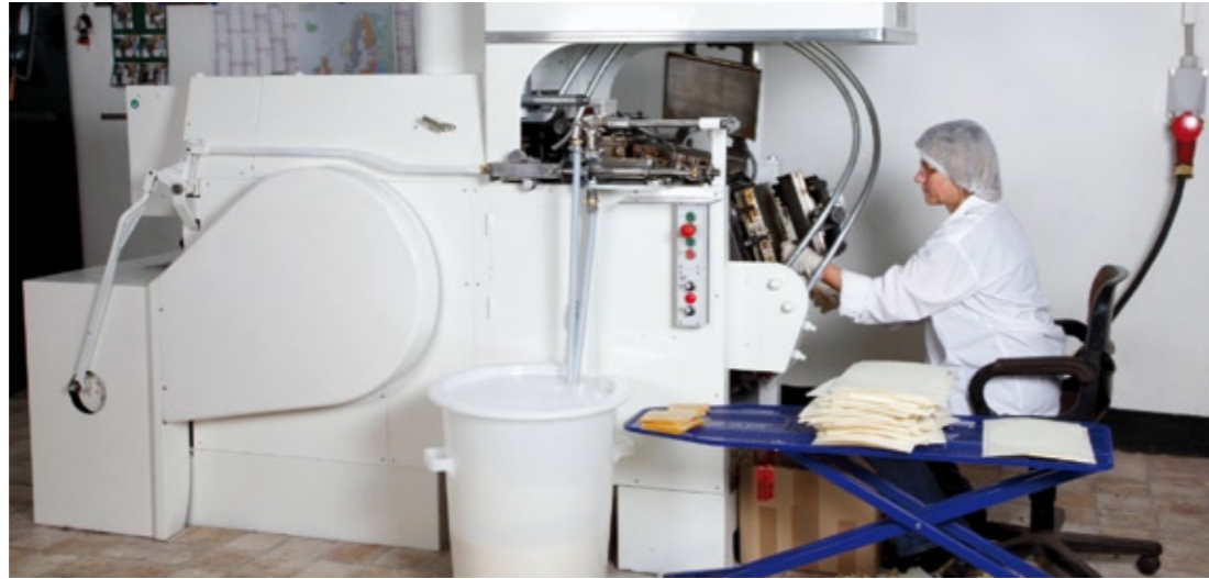
En esta máquina acondicionada probaron las trabajadoras del dpto. de ventas ellas mismas el horneado.