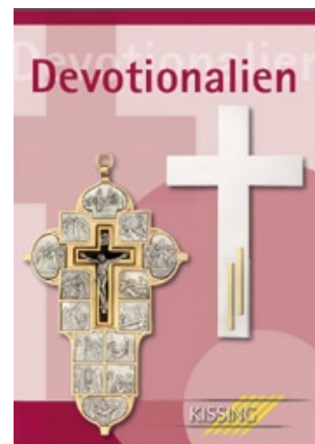
Nuestro catálogo devocionario.

Si usted tiene interés en símbolos de fe diseñados de forma original y artística, solicite nuestro catálogo de varias páginas que puede también descargar directamente a través de Internet. Suministramos una gran gama de cruces, medallas y rosarios. Como fabricantes suministramos también símbolos de fe individualizados según sus preferencias. En la portada de nuestro catálogo se ilustra una cruz de pared fabricada de forma artesanal con motivos estampados que representan las estaciones del vía crucis de Cristo. Fabricamos esta cruz metálica desde hace más de 100 años con la misma forma. Se caracteriza especialmente por su excelente acabado.