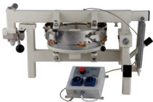
Máquina de hacer hostias HB-95-F ahora con resorte regulador (en la foto a la derecha).

Quien tenga interés en modificar su máquina de hacer hostias, puede solicitarnos una oferta.